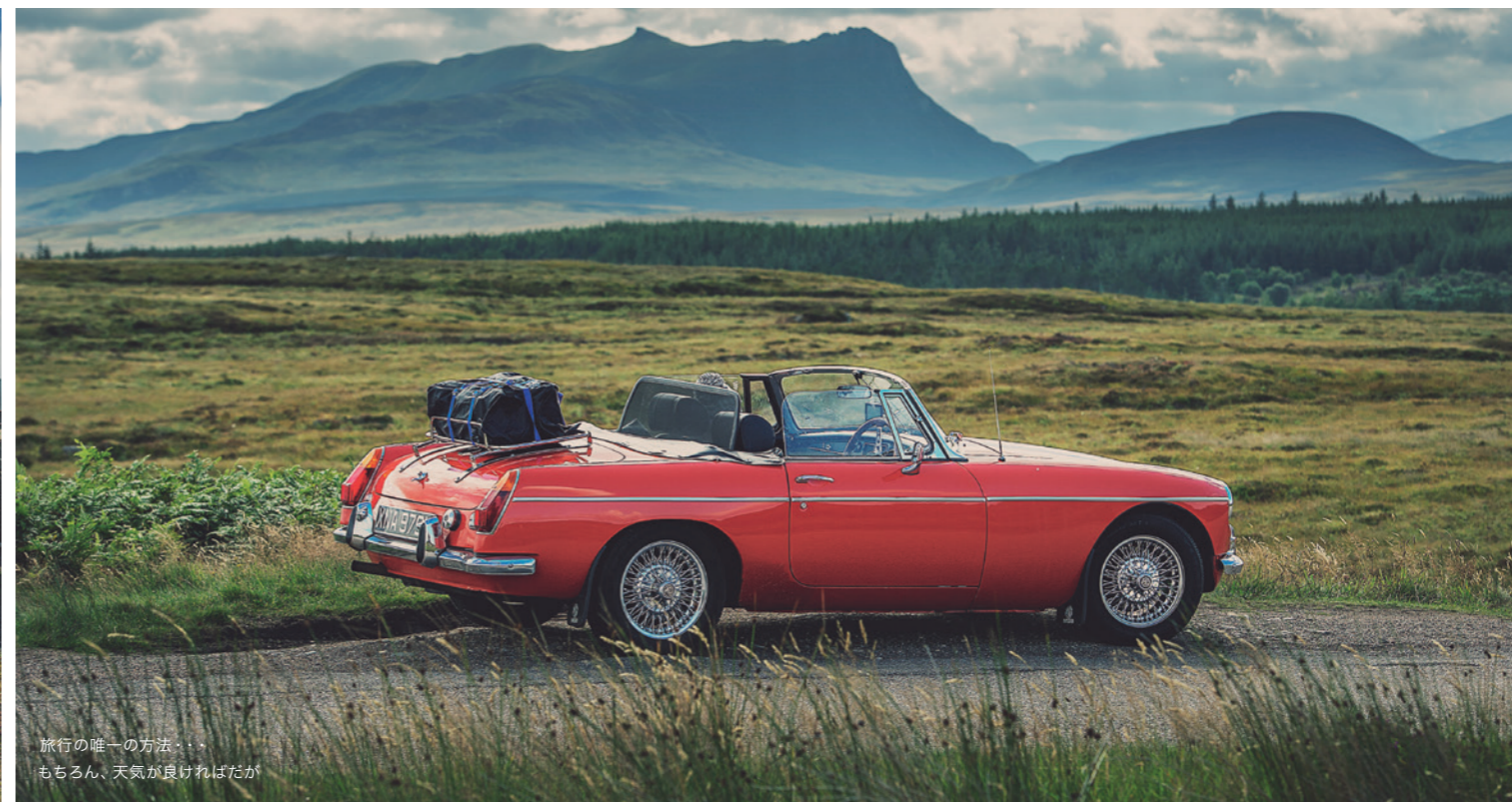
旅行の唯一の方法・・・もちろん、天気の良い日だが