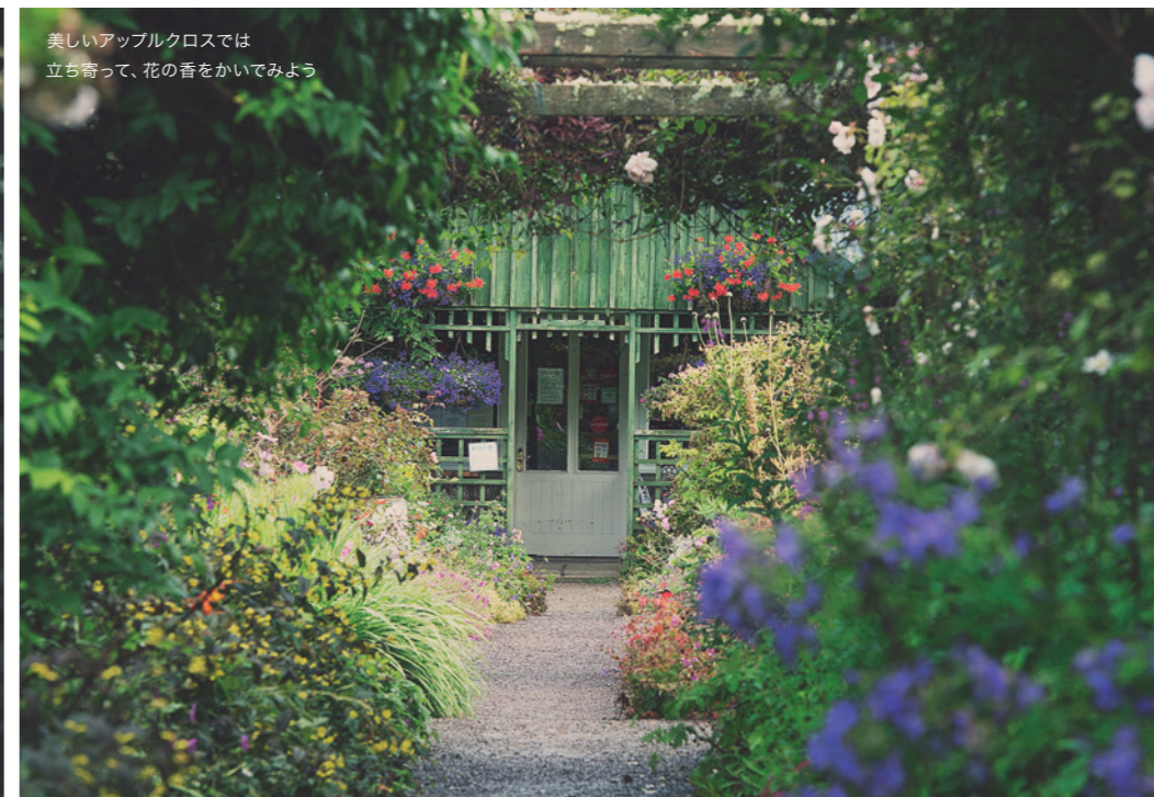
美しいアップルクロスでは立ち寄って、花の香をかいでみよう