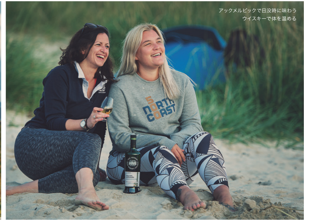
アックメルビックで日没時に味わう ウイスキーで体を温める

地元のバーでは歌とダンスのにぎやかなパーティが行われていて、休憩に訪れたドライブ旅行者たちが、伝統音楽に身を浸し、ハイランドのダンスに挑戦しようとしていました。しかし私たちは、2日目の夜をアックメルビックで過ごすために、先を急ぎ、アシント地区の大自然の中へと向かうことにしました。