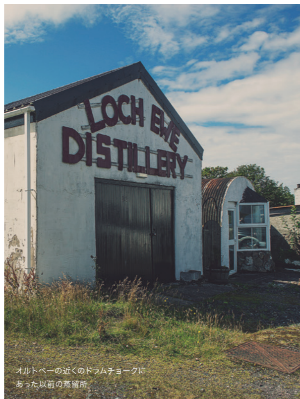
オルトベアの近くのドラムチョークにあった以前の蒸留所